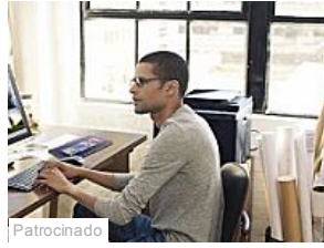
Patrocinado PCs tradicionais não devem fazer tarefas de workstation (Dell)