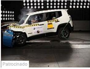
Patrocinado Jeep Renegade é o mais seguro carro nacional