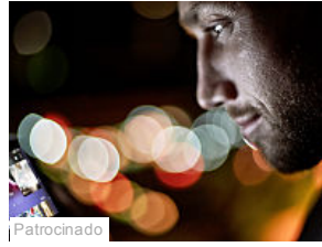
Patrocinado A bateria do seu smartphone acaba rápido demais? Conheça o Modo Stamina (Sony Blog)